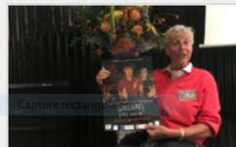
Les sorcières de passage à Orléans pour deux jours publié le 24/09/2020