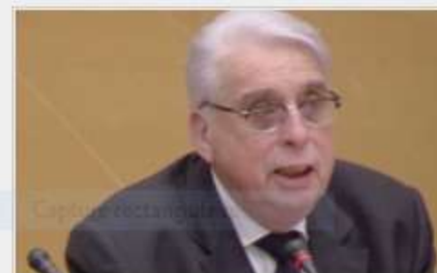
Jean Pierre Sueur s'interroge sur le tourisme ministériel dans le Loiret publié le 23/09/2020