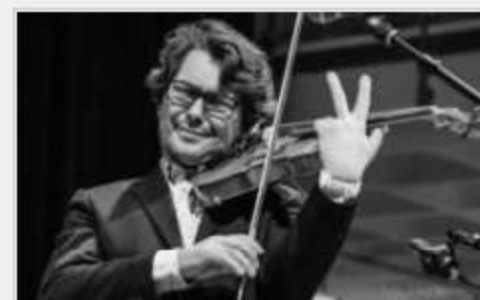
Orléans: jazz pas mort ! publié le 23/09/2020