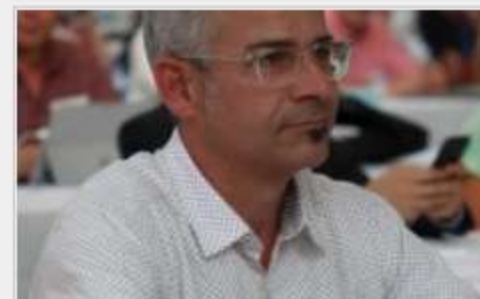
Tours : les élus écologistes sous le feu des critiques publié le 23/09/2020