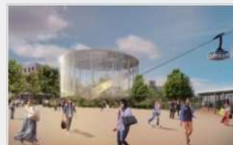
Orléans-Fleury: le téléphérique décroche publié le 24/09/2020